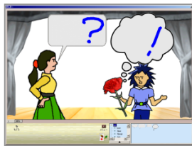
絵を見て会話を作ろう (キャラクターや背景を利用)

素材集の材料を イメージモード で読み込んでそ れにフキダシや 背景を添えると 会話場面がで き上がる